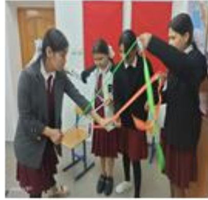
18.01.2023ж «Анаға, әкеге, отбасы мүшелеріне құрмет-маңызды постулат» (қыздарға арналған дәріс сабақ)